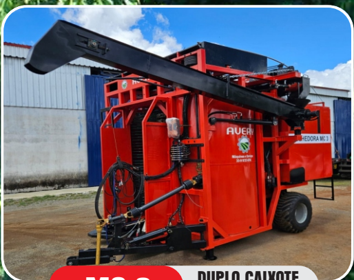
MC 3 DUPLO CAIXOTE BICA MÓVEL