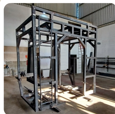
Esqueleto tipo gaiola travada em vários pontos para reforçar toda a estrutura da máquina.