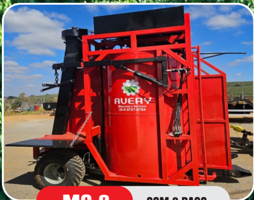
MC 2 COM 2 BAGS