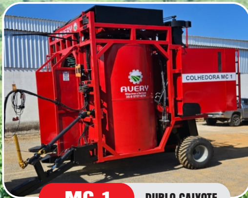
MC 1 DUPLO CAIXOTE

Sistema totalmente em cardam, sem bomba hidráulica ou motores elétricos para movimentação de todo o conjunto. Mais simplicidade e menor custo de manutenção.