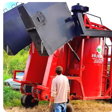
Caixotes basculares com capacidade de 25 medidas de 60 litros cada um, que elevam à altura de 2,50 metros do solo.