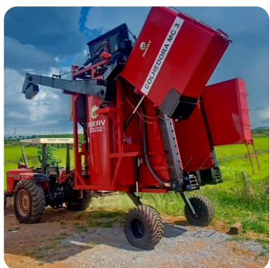
Eixo das rodas preparado com pistão que atinge altura da máquina até 1,3 metro em ambos os lados.