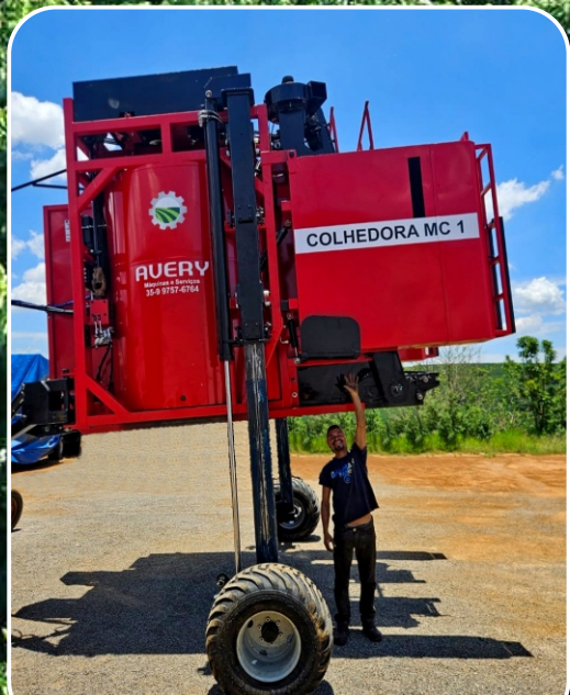
Terraço ESPECIAL TERRACIAMENTO