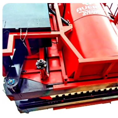
Estrutura do chassi reforçada para suportar carga e trabalho em ambientes rústicos.