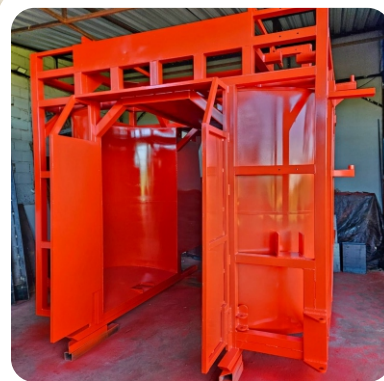
Pintura especial automotiva