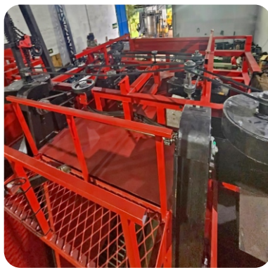
Sistema de movimentação da máquina através de roldanas e correias, de simples operação e fácil manutenção.