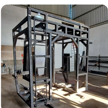
Esqueleto tipo gaiola travada em vários pontos para reforçar toda a estrutura da máquina.