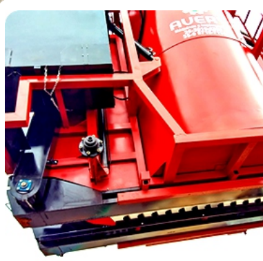
Estrutura do chassi reforçada para suportar carga e trabalho em ambientes rústicos.