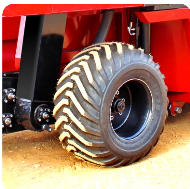
Eixo reforçado com pneus novos (balão) HF 75 com 16 lonas.