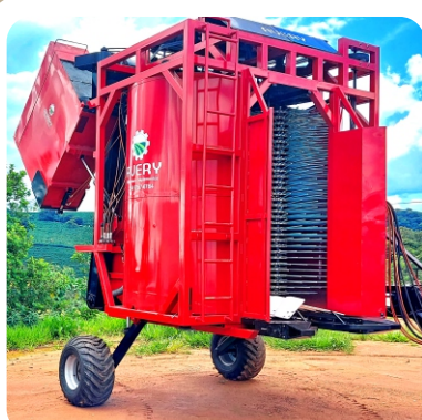
Eixo das rodas preparado com pistão que atinge altura da máquina até 1,3 metro em ambos os lados.