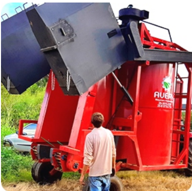
Caixotes basculares com capacidade de 25 medidas de 60 litros cada um, que elevam à altura de 2,50 metros do solo.