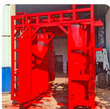
Pintura especial automotiva