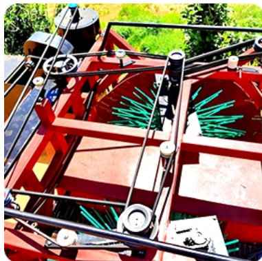
Sistema de movimentação da máquina através de roldanas e correias, de simples operação e fácil manutenção.