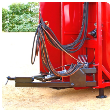
Engate no rabicho, estrutura reforçada com movimentação ascendente e descendente para a direita e esquerda.